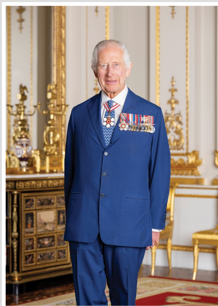
PORTRAIT CANADIEN OFFICIEL 2024