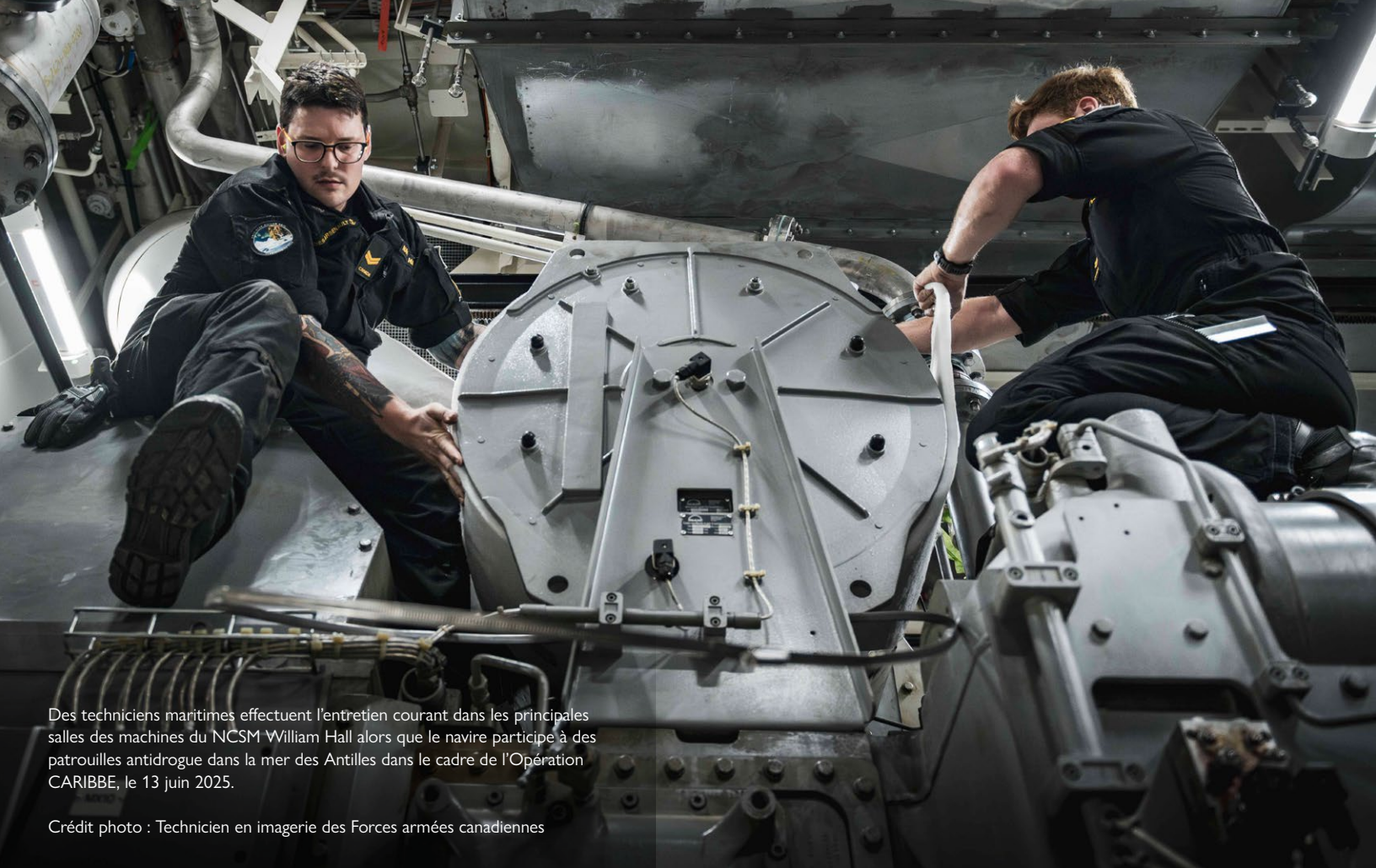
Des techniciens maritimes effectuent l'entretien courant dans les principales salles des machines du NCSM William Hall alors que le navire participe à des patrouilles antidrogue dans la mer des Antilles dans le cadre de l'Opération CARIBBE, le 13 juin 2025.