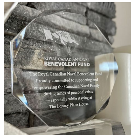
RECONNAISSANCE DU SOUTIEN DU FBMRC À LA SOCIÉTÉ LEGACY PLACE.

Le FBMRC a établi une présence « marine » dans chacun des trois sites de la Legacy Place Society afin d'aider l'organisme à répondre aux besoins des anciens combattants avec attention, efficacité et dignité.