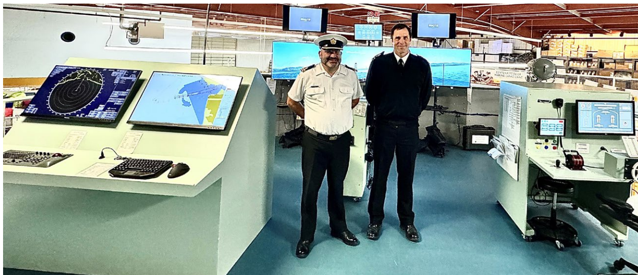
LE VICE-AMIRAL ANGUS TOPSHEE (À DROITE), CMRC, VISITE LE PROJET DE SIMULATEUR EN COMPAGNIE DU LTV DON FIGOL, FORMATEUR.